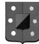
MAIRIE DE PRESSIGNAC VICQ