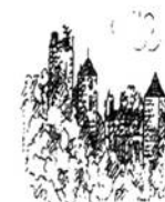
MAIRIE DE BANEUIL