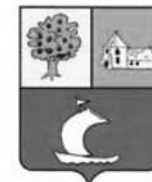
MAIRIE DE MAUZAC ET GRAND CASTANG